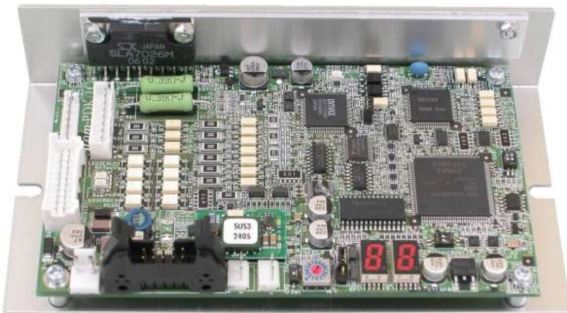
【第 1. 0 版】

“Atom-PDK/1C”は通信により制御されることを基本としており、DYNAX製の高性能ACサーボ位置決めドライバ“Atom(Atom-SLIM)”シリーズと共通プロトコルになっていますので、同一通信システム内に複数のACサーボドライバ、複数のパルスモータドライバ、センサ入力等を配置することが可能となります。RS485で接続するためモータの近傍への配置が可能となり、省線化のメリットのみならず、耐ノイズ性能の向上が見込めます。